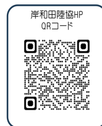
岸和田陸協HP QRコード